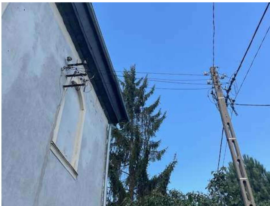
Fot. 1 Widoczne przyłącze napowietrzne do wymiany