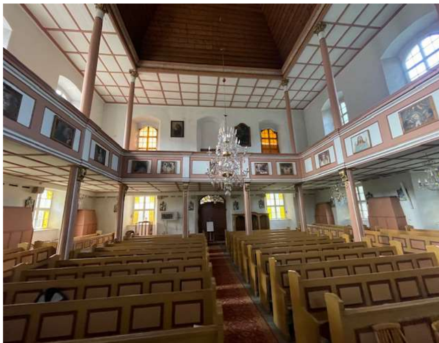
Fot. 3 Widoczne wnętrze kościoła