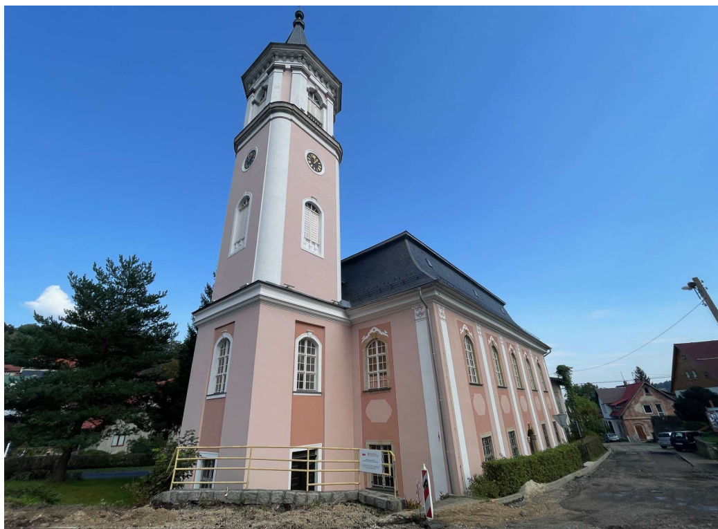
Kościół filialny pw. Niepokalanego Serca Najświętszej Maryi Panny w Szklarskiej Porębie

Są to prace określane jako „pierwsza potrzeba”. Modernizacja instalacji elektrycznej znacznie poprawi bezpieczeństwo wiernych uczęszczających do kościoła podczas Mszy Świętych oraz w trakcie uroczystości kościelnych i patriotycznych. Kościół, dzięki swoim walorom estetycznym, jest również udostępniany zwiedzającym, pielgrzymom oraz licznym grupom działającym przy parafii.