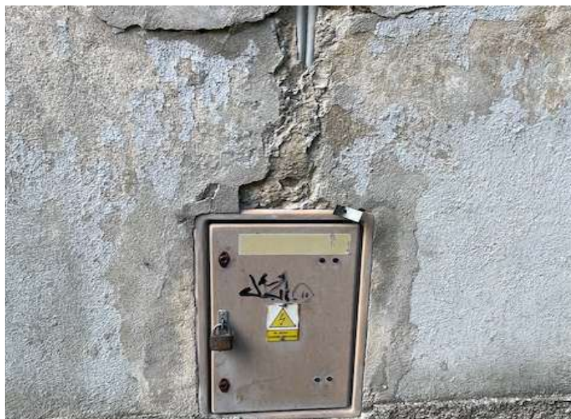
Fot. 2 Widoczna szafka ZK na elewacji oraz widoczne nieotynkowane przewody WLZ