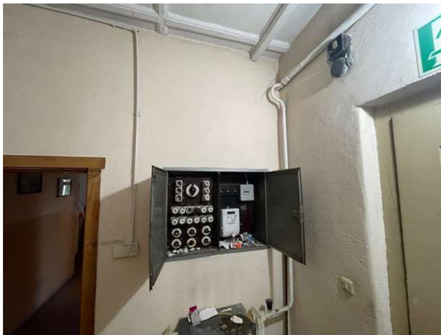
Fot. 5 Rozdzielnica główna z tablicą licznikową