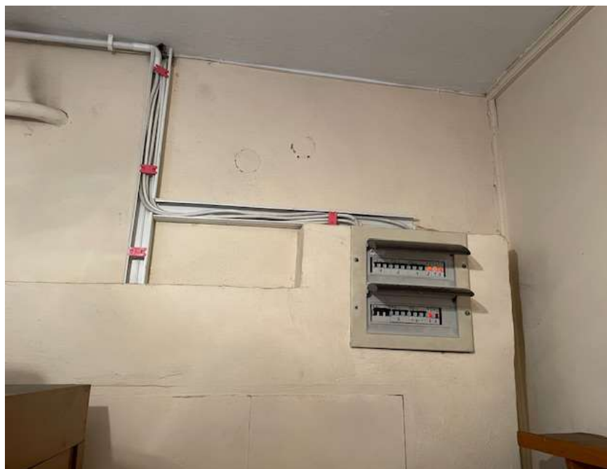
Fot. 4. Rozdzielnica pośrednia